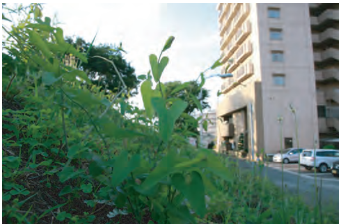
住宅地にもしっかり自生しています