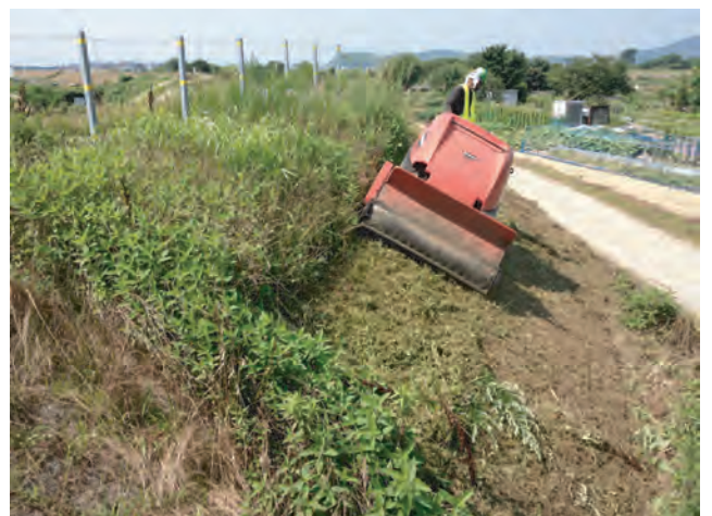
自生地の草刈が始まりました