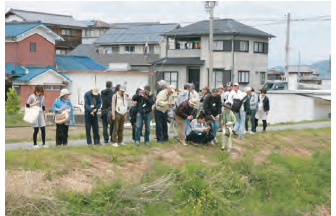
自生地の調査をする協議会のメンバー