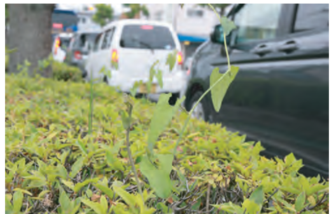
街路樹の歩道の植え込みにも見つかりました