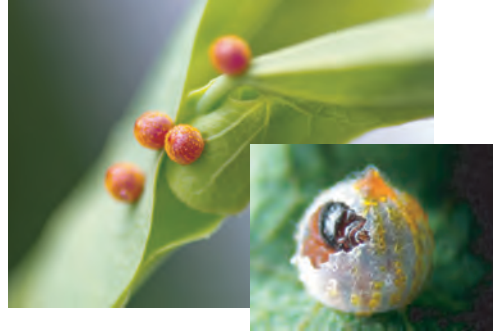
ジャコウアゲハのタマゴ と 幼虫の誕生

アゲハチョウの仲間の幼虫は、ミカンやサンショウ・ニンジンなどの農作物を食害しますが、ジャコウアゲハの幼虫はウマノスズクサしか食べないので、決して農作物に害を及ぼすことはありません。