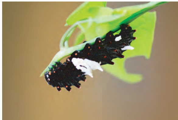
ジャコウアゲハの幼虫