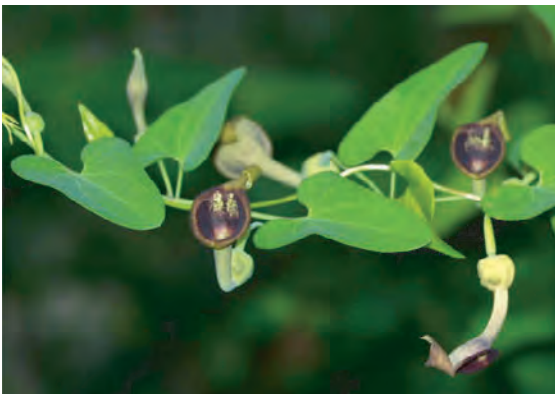
ウマノスズクサとその花

私たち「ジャコウアゲハが飛び交う街 連絡協議会」のメンバーは姫路市の企業・団体や小学校などと連携して、ウマノスズクサの自生地を殖やす運動を展開しています。