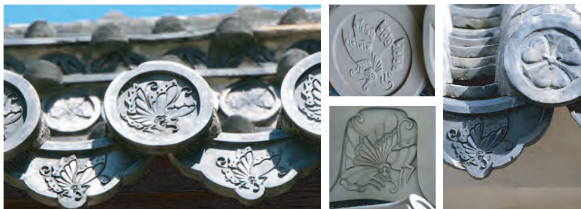
「ジャコウアゲハが飛び交う街姫路 連絡協議会」

アゲハチョウは形も大きく、よく目に触れる機会の多い美しい蝶であり、また総称でも使われる蝶の代表です。「市蝶・ジャコウアゲハ」は、その仲間、姫路市とも多くの関係を持っているので、多くの市民の皆さまに愛されることを希望します。