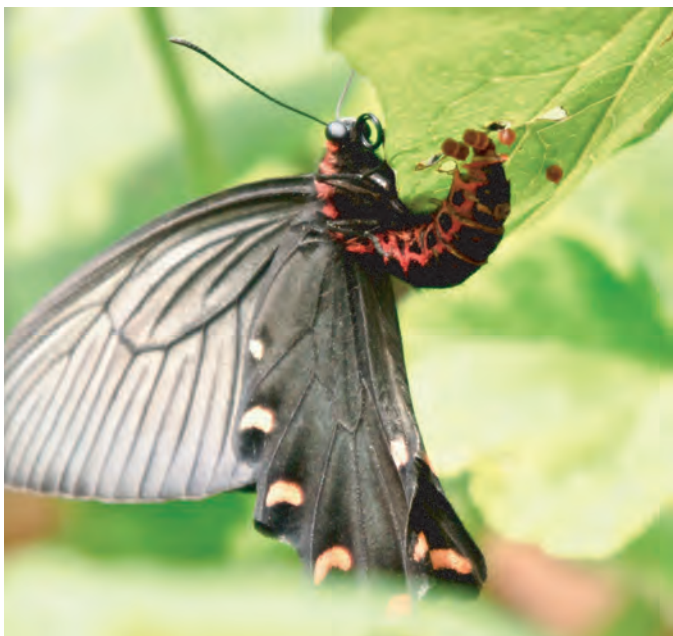
マノスズクサに産卵するジャコウアゲハ